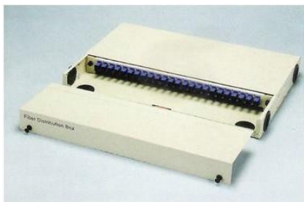
※12C 尺寸 19" x 300(D) x 76(H)