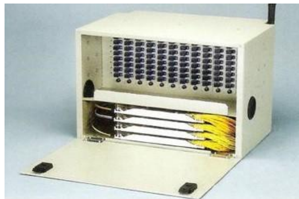
※96C 尺寸 19" x 300(D) x 285(H)